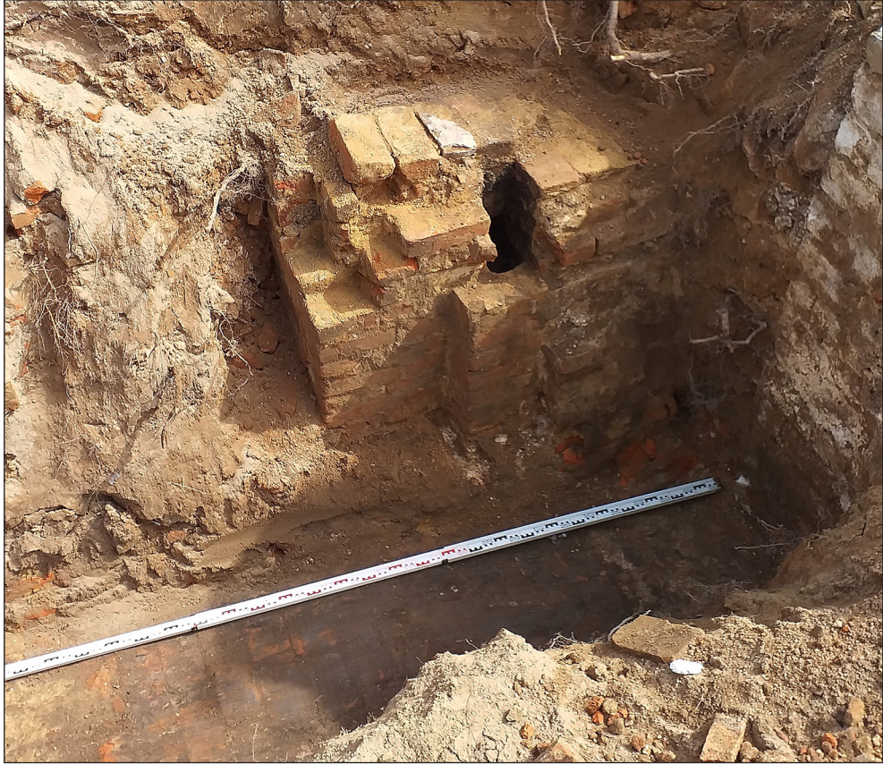
Ryc. 2. Relikty piwnicy kamienicy odkrytej w trakcie prac przy II LO w Stargardzie.