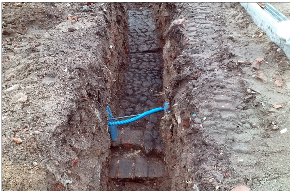
Ryc. 1. Fragmenty bruku odkrytego w trakcie prac ziemnych przy II LO w Stargardzie.