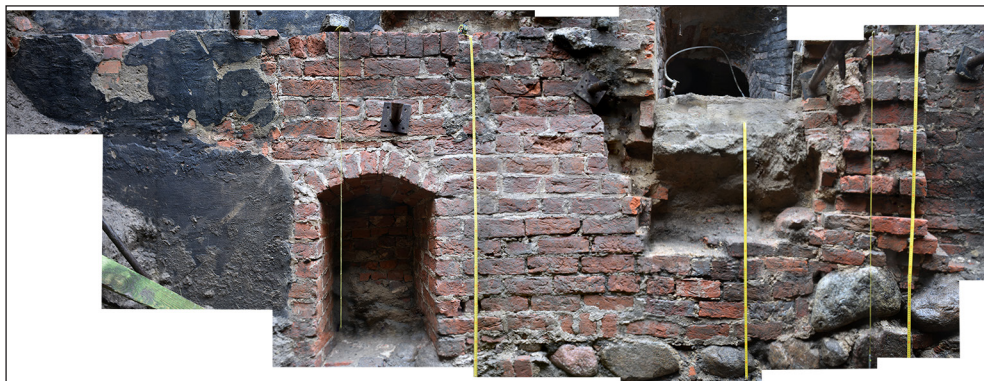
Ryc. 3. Odkryta N ściana fundamentowa plebanii z widocznym zamurowanym przejściem. Oprac. M. Szeremeta, MAH w Stargardzie