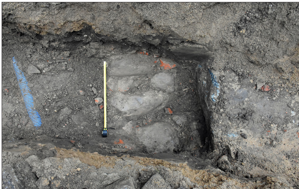
Ryc. 4. Mur kamienny dawnego ogrodzenia kościoła NMP Królowej Świata w Stargardzie.